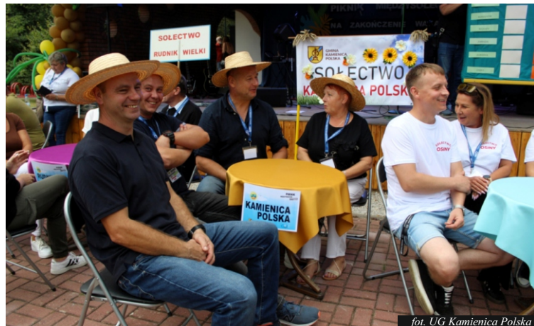
fol. UG Kamienica Polska