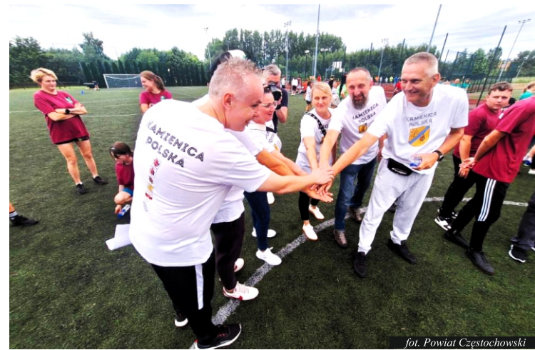
fol. Powiat Częstochowski