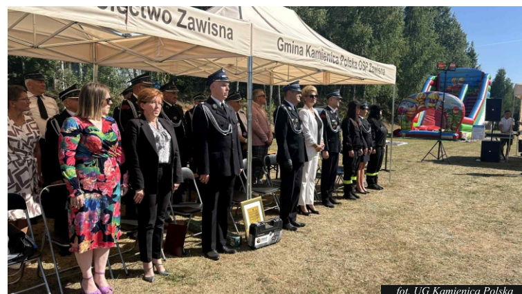
fol. UG Kamienica Polska