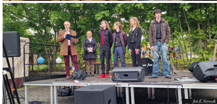
fol. E. Nowak