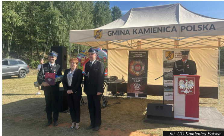
fol. UG Kamienica Polska