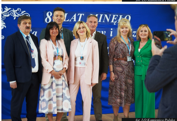
fol. LO Kamienica Polska