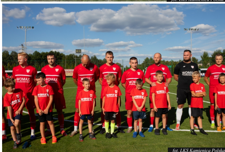
for. LKS Kamienica Polska

zagra drużyna żaków odbędą się w Poczesnej, Poraju i Starczy. Obecnie w naszym klubie trenuje ponad 70 zawodników w różnych kategoriach wiekowych. Tak dobre wyniki naszych drużyn to zasługa zawodników, trenerów pracujących w klubie, sponsorów i rodziców naszych najmłodszych zawodników.