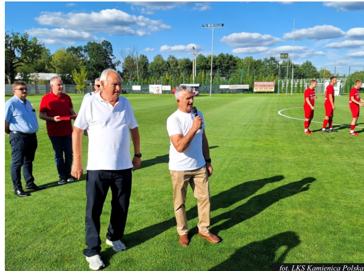
fol. LKS Kamienica Polska

Obecnie, drużyna seniorów gra w okręgówce i żeby tak było trzeba przygotować nowych zawodników, którzy poprzez treningi i grę w drużynach młodzieżowych będą