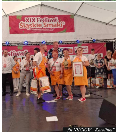
fol. NKGiGW „Karolinki”