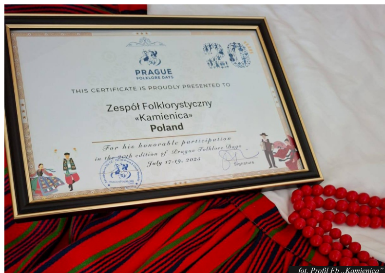
fol. Profil Fb „Kamienica”