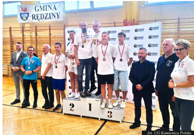
fol. UG Kamienica Polska