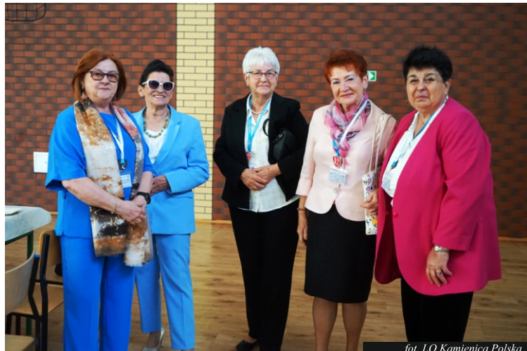
fol. LO Kamienica Polska