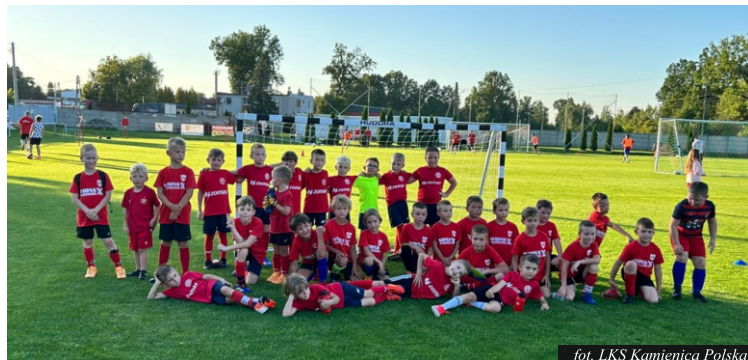
for. LKS Kamienica Polska

W okresie przygotowawczym zostały połączone w jedną drużynę, drużyna trampkarzy oraz junior młodsi. LKS zgłosił do rozgrywek w nowym sezonie drużynę seniorów - trzecia liga śląska - klasa okręgowa, juniorów młodszych gra poza unifikacją, orlików oraz drużynę żaków. Rozgrywki w nowym sezonie prowadzi Śląski Związek Piłki Nożnej oraz Podokręg Częstochowa. Na dzień dzisiejszy drużyna seniorów po rozegraniu pięciu meczów jest na trzecim miejscu w tabeli tracąc do lidera jeden punkt. Seniorzy wygrali z drużynami z Psar-Babienicy, Lotnika Kościelec „Jedność Boronów oraz LKS Zieloni Żarki oraz doznali jednej porażki z drużyną z Kłomnic w Kłomnicach w stosunku 4:5. Juniorzy młodsi w swojej klasie rozgrywkowej spisują się bardzo dobrze po rozegraniu czterech meczy. Są na czele tabeli, zostawili w pokonanym polu drużyny z Kiedrzyń, Złotego Potoku, Szarlejki, ponieśli jedną porażkę na boisku w Hucie Starej. Drużyna orlików zaczyna dopiero swoje rozgrywki, rozegrała ona jeden mecz ulegając drużynie Skra Częstochowa. Najmłodsi piłkarze naszego klubu - żaki rocznik 2017 i młodsi w dniu 1 września byli gospodarzem turnieju w którym uczestniczyły drużyny z Poraja, Poczesnej i Starczy. Drużyna żaków wygrała dwa mecze pokonując drużyny z Poraja i Poczesnej oraz poniosła porażkę jedną bramką z drużyną ze Starczy. W czasie trwania turnieju widać było radość u naszych najmłodszych zawodników. Kolejne turnieje w których