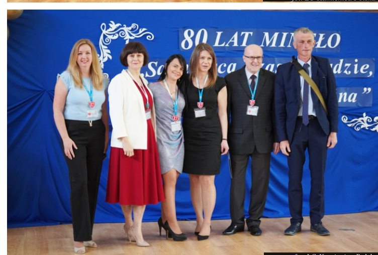
fol. LO Kamienica Polska