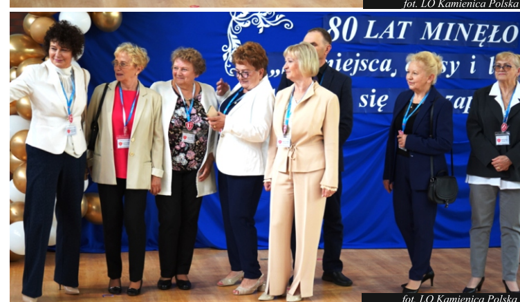
fol. LO Kamienica Polska