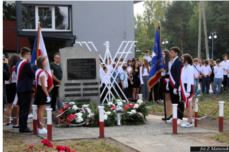
fol. Z. Matusiak