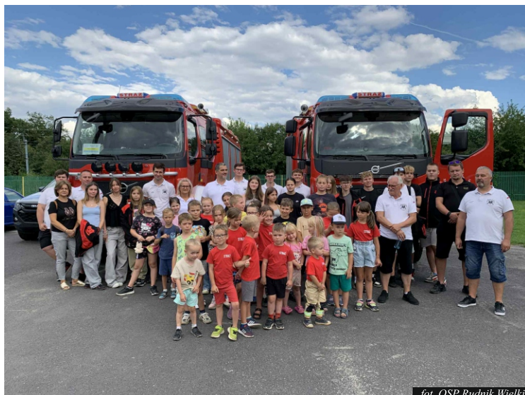
fol. OSP Rudnik Wielki