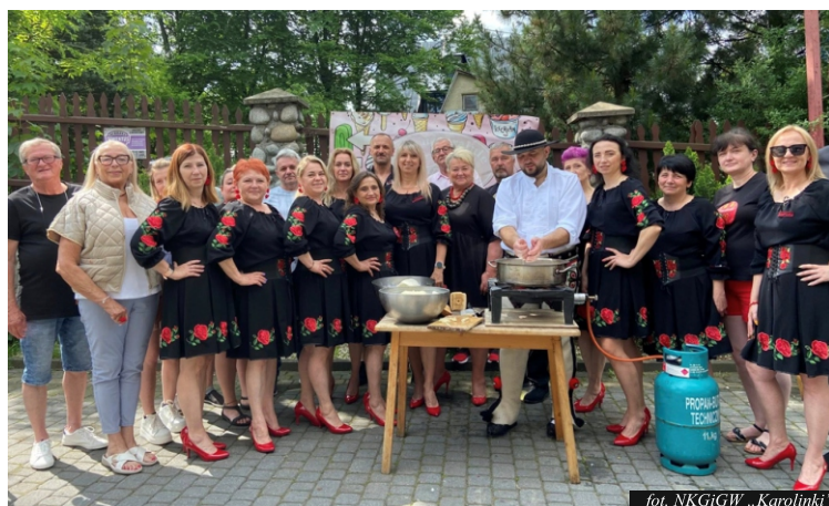
fol. NKGiGW „Karolinki”

Dnia 12 czerwca br. NKGiGW „Karolinki” po raz kolejny udowodniło, że potrafi łączyć tradycję, pasję i zaangażowanie z promocją naszej Małej Ojczyzny. Tym razem reprezentantki i reprezentanci gminy mieli okazję gościć pod Tatrami, gdzie uczestniczyli w wyjątkowej kulinarnej przygodzie. Jednym z najważniejszych punktów pobytu były warsztaty kulinarne, podczas których „Karolinki” uczyły się tradycyjnego wyrobu oscypków – słynnego, góralskiego przysmaku, wpisanego na listę produktów regionalnych. Była to nie tylko cenna lekcja lokalnych smaków i tradycji, ale również okazja do wymiany doświadczeń kulinarnych i integracji z gospodarzami regionu. Podczas pobytu „Karolinki” nie tylko zdobywały nowe umiejętności, lecz także z wdziękiem i otwartością promowały kulturę i dziedzictwo naszej Gminy. Ich serdeczność wzbudziły uznanie zarówno u lokalnych gospodarzy, jak i u gości z całej Polski. Dzięki takim wydarzeniom nasza Gmina