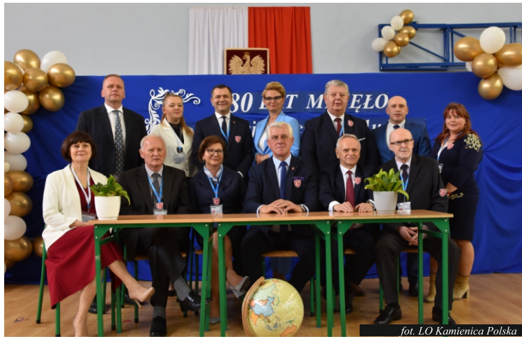
fol. LO Kamienica Polska