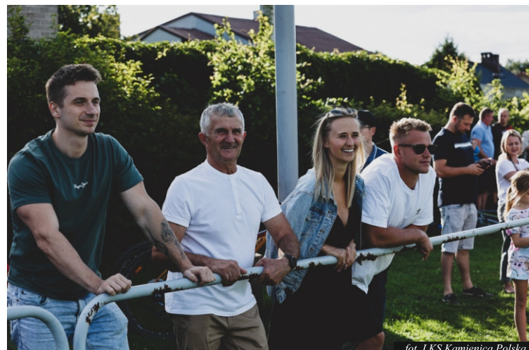
fol. LKS Kamienica Polska