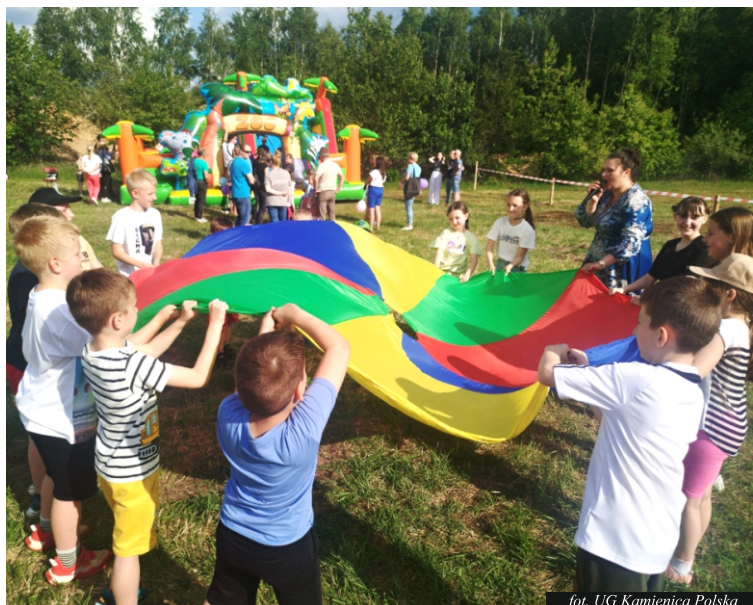
fol. UG Kamienica Polska

Dnia 31 maja br, plac przy OSP w Zawadzie zamienił się w barwne centrum zabawy i rodzinnej integracji. Z okazji Dnia Dziecka przygotowano wydarzenie, które zgromadziło licznych mieszkańców gminy Kamienica Polska. Na najmłodszych czekały liczne atrakcje – gry i zabawy, animacje, konkursy oraz słodkie niespodzianki. Każde dziecko mogło znaleźć coś dla siebie. Rozmowy, śmiech, muzyka i zapach smakołyków sprawiły, że wydarzenie stało się nie tylko świętem dzieci, ale i okazją do integracji całej społeczności. Organizatorami imprezy była OSP Zawada przy wsparciu sołectwa, Gminy Kamienica Polska oraz zaangażowanych mieszkańców. Tegoroczny Dzień Dziecka w Zawadzie pokazał, jak ważne są lokalne inicjatywy i jak wiele radości mogą przynieść, gdy łączą siły strażacy, samorząd i społeczność.