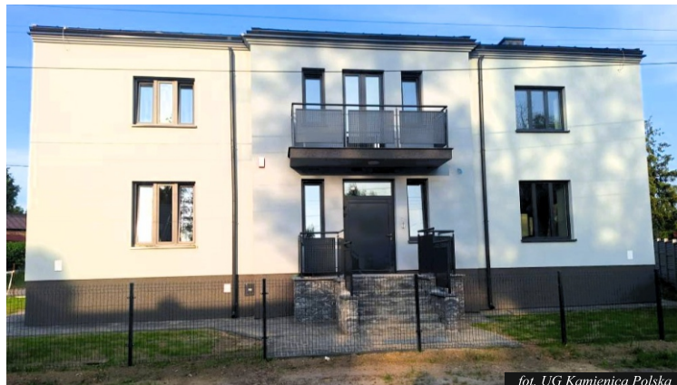
fol. UG Kamienica Polska

Co to oznacza dla mieszkańców Gminy Kamienica Polska? Centrum Usług Społecznych (CUS) to nowoczesna jednostka, której głównym celem jest kompleksowe wspieranie osób potrzebujących. Dzięki przekształceniu mieszkańcy zyskają: Szeroki zakres usług : Centrum będzie oferowało pomoc w zakresie wsparcia socjalnego, doradztwa, pomocy dla rodzin, osób starszych oraz osób z niepełnosprawnościami. Nowoczesne rozwiązania : CUS wprowadza uproszczenie procedur, cyfryzację i lepszą dostępność usług. Dzięki temu, załatwianie spraw w urzędzie stanie się prostsze i szybsze. Pomoc dostosowana do indywidualnych potrzeb : Centrum będzie świadczyło usługi w sposób zindywidualizowany, biorąc pod uwagę specyficzne potrzeby mieszkańców – od wsparcia psychologicznego po doradztwo prawne czy pomoc w kryzysach życiowych. Współpraca z innymi instytucjami : CUS będzie ściśle współpracować z innymi instytucjami społecznymi, organizacjami pozarządowymi oraz służbami porządkowymi, co pozwoli na szybsze i skuteczniejsze reagowanie na potrzeby mieszkańców.