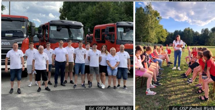
fol. OSP Rudnik Wielki