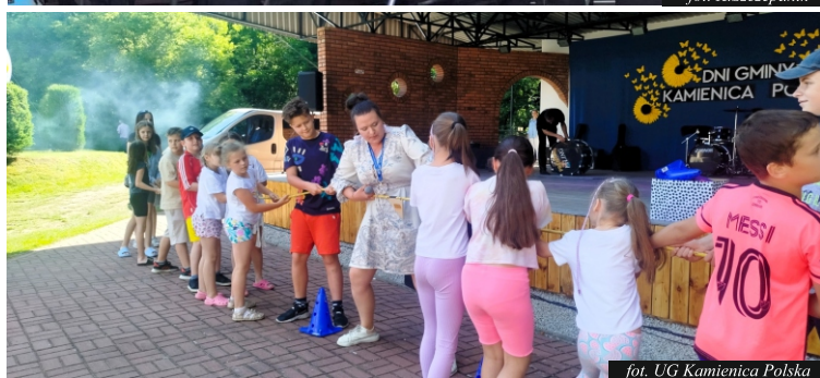
fot. UG Kamienica Polska