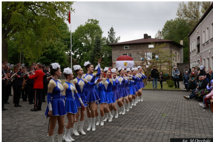
fol. M. Otrebski