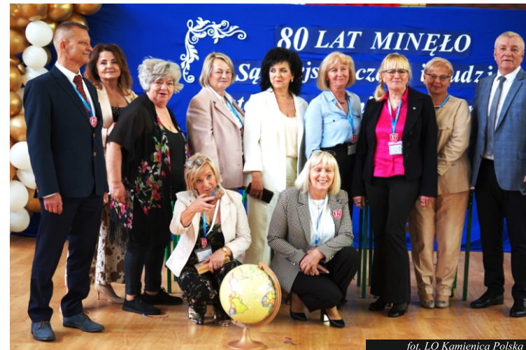
fol. LO Kamienica Polska