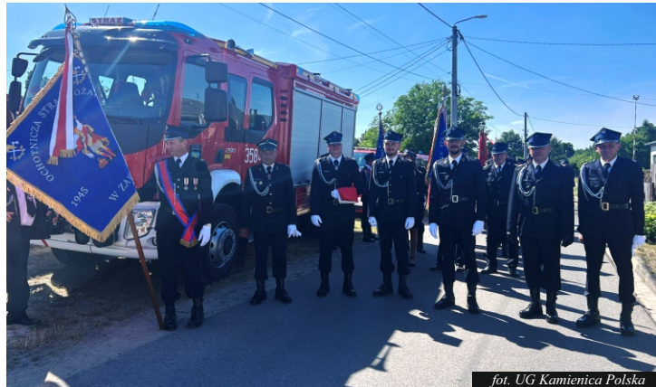
fol. UG Kamienica Polska

z tej wyjątkowej rocznicy. Po części oficjalnej na uczestników czekała część festynowa z licznymi atrakcjami, a wieczór zakończyła taneczna zabawa, która przyciągnęła zarówno młodszych, jak i starszych Mieszkańców. Dziękujemy wszystkim Mieszkańcom, Gościom oraz Organizatorom za obecność i wspólne świętowanie tej pięknej rocznicy! Szczególne podziękowania należy skierować do druhów z OSP Zawisna – za ich wieloletnią służbę, poświęcenie i codzienną gotowość do działania.