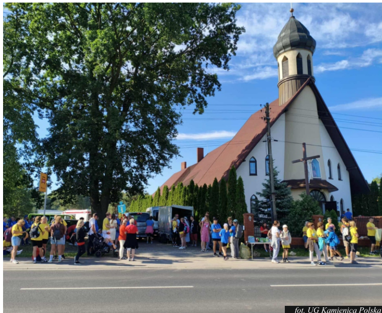
fol. UG Kamienica Polska