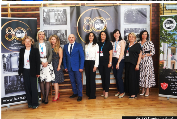
fol. LO Kamienica Polska