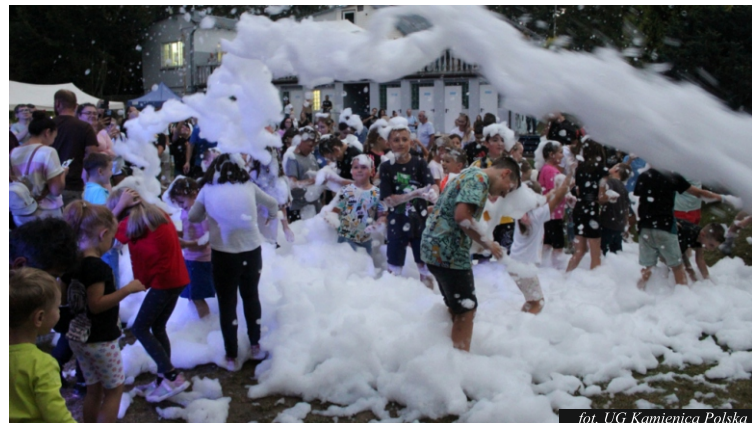
fol. UG Kamienica Polska