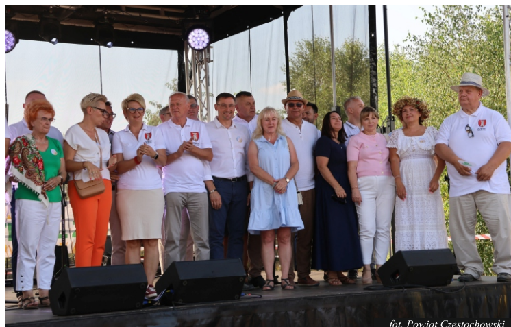
fol. Powiat Częstochowski