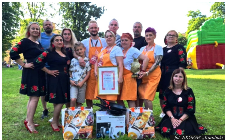
fol. NKGiGW „Karolinki”