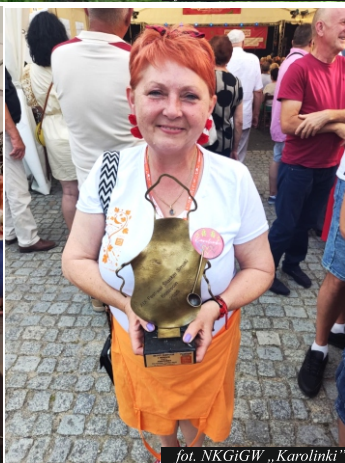
fol. NKGiGW „Karolinki”

Dnia 15 czerwca br., w malowniczym Koszęcinie, odbyła się XIX edycja Festiwalu „Śląskie Smaki”. To jedno z najważniejszych i najbardziej prestiżowych wydarzeń kulinarnych w regionie, które od lat przyciąga zarówno miłośników śląskiej kuchni, jak i pasjonatów tradycji z całej Polski. W tegorocznej edycji publiczność mogła podziwiać zmagania kulinarne w kilku kategoriach, a także spróbować wyjątkowych specjałów przygotowanych przez najlepszych kucharzy – zarówno profesjonalistów, jak i amatorów. Z ogromną dumą informujemy, że NKGiGW „Karolinki” sięgnęło po I miejsce w kategorii amatorów! Nasze reprezentantki i reprezentanci nie tylko zachwycili jury, ale również zdobyli serca publiczności. Ich potrawy wyróżniały się perfekcyjnym wykonaniem i ogromną dbałością o autentyczną, śląską tradycję kulinarną. To zwycięstwo jest pięknym przykładem, że tradycję można z powodzeniem łączyć z nowoczesnością. Serdeczne gratulacje składamy całemu zespołowi – to wielkie wyróżnienie i zasłużony sukces, który pokazuje, że ciężka praca, zaangażowanie i miłość do kulinarnego dziedzictwa zawsze przynoszą piękne owoce. Dzięki Waszej determinacji i talentowi mieszkańcy naszej Gminy oraz całego regionu mogą być dumni z bogactwa śląskiej kuchni. XIX Festiwal „Śląskie Smaki” zyskał dzięki Wam kolejny, wyjątkowy i niezapomniany rozdział.