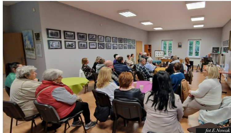
fol. E. Nowak