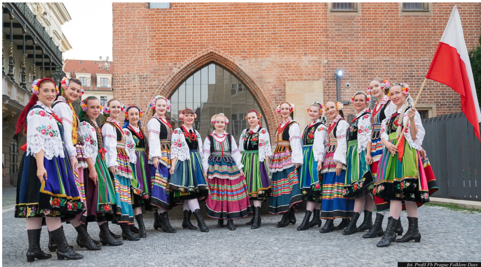
fol. Profil Fb Prague Folklore Days

W dniach 17–20 lipca 2025 roku Zespół Folklorystyczny „Kamienica” przeżył wyjątkową przygodę uczestnictwa w prestiżowym międzynarodowym festiwalu Prague Folklore Days w Czechach. To jedno z największych wydarzeń folklorystycznych w Europie, które co roku gromadzi tysiące artystów z całego świata. Podczas pobytu w Pradze nasze artystki miały zaszczyt dwukrotnie wystąpić na scenie w samym centrum miasta, prezentując barwny program artystyczny. Niezwykle widowiskowym przeżyciem była również parada ulicami Pragi, w której wzięło udział około 2 tysiące wykonawców z 35 krajów, reprezentujących blisko 60 zespołów folklorystycznych. Kolorowe stroje, muzyka, taniec i śpiew stworzyły niepowtarzalny klimat, który poruszył zarówno uczestników, jak i publiczność. – Każdy dzień był pełen wrażeń, radości i folkloru. Cudownie jest mieć pasję i dzielić się nią z innymi – podkreślają uczestniczki wyjazdu. Wspomnienia z Pragi, pełne emocji i inspiracji, na długo pozostaną w sercach całej grupy.