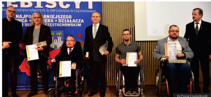
fol. Powiat Częstochowski