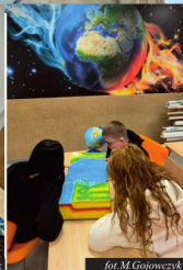
fol. M. Gojowczyk