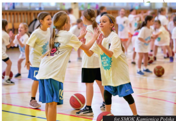
for:SMOK Kamienica Polska

Po co nam ten SMOK? Dzięki niemu około 80 dzieciaków z naszej gminy, ale nie tylko, bo przyjeżdżają do nas z gmin sąsiednich oraz Częstochowy, może uczestniczyć w zajęciach koszykówki w trzech grupach, dzięki czemu treningów prowadzonych przez kadrę UKS jest więcej dla większej liczby odbiorców. Mamy teraz także zajęcia dla dzieci w wieku przedszkolnym realizowane we współpracy z Gminnym Przedszkolem oraz jego filiami. Dodatkowo grupy z klas 1, 2 i 3 oraz 4-6, które mają więcej zajęć koszykarskich. SMOK pokrywa wynagrodzenia trenerów za te dodatkowe zajęcia, dostarcza pakiet sprzętu, know-how oraz szkolenia dla trenerów. Dzięki czemu UKS Dwójka może rozwijać więcej grup koszykarskich na wyższym poziomie. Oprócz ściśle koszykarskich zajęć możemy liczyć na różne eventy, szkolenia czy wyjazdy na mecze kadry Polski dla uczestników. Uks Dwójka wspiera ten projekt również poprzez warsztaty z psychologiem