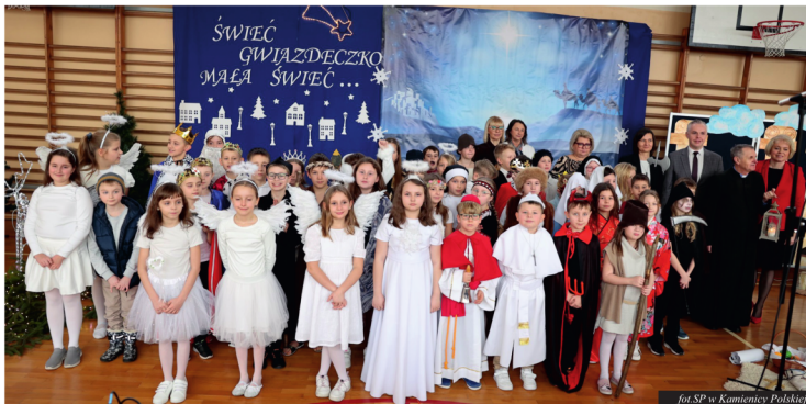
fol.SP w Kamienicy Polskiej

W dniu 19 grudnia 2025 r. w szkole odbyły się Jasełka bożonarodzeniowe przygotowane przez uczniów klas trzecich. Przedstawienie nawiązywało do tradycji bożonarodzeniowej oraz narodzin Jezusa Chrystusa, niosąc ze sobą ważny przekaz o miłości, pokoju i wzajemnym szacunku.