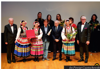
fol. Powiat Częstochowski

Gratulacje należą się wszystkim nominowanym i nagrodzonym. Z dumą informujemy, że wśród nagrodzonych znaleźli się przedstawiciele Gminy Kamienica Polska: Statuetkę otrzymali: Zespół