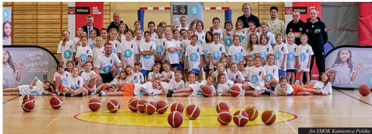
for:SMOK Kamienica Polska