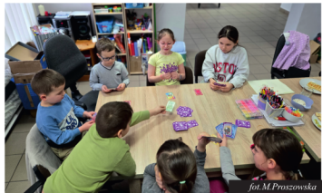
fol. M. Proszowska

Początek roku w naszej świetlicy poświęcony był tematyce „Zimy wokół nas” m.in. jak pomagać naszym mieszkańcom przetrwać zimę i mrozy. Okres ferii upłynął nam w radosnej, twórczej i bezpiecznej atmosferze. Dzieci chętnie uczestniczyły w przygotowaniach zajęć, wykazując się kreatywnością, zaangażowaniem i dużą ciekawością świata. To był czas pełen uśmiechu, współpracy i rozwijania pasji. W wycieczkaniu na pierwsze promienie wiosennego słońca zmieniliśmy dekorację w świetlicy. Tematem przewodnim stały się kwiaty i motyle, wykonane przez dzieci różnymi technikami plastycznymi.