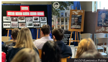
fol. LO Kamienica Polska