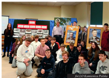
fol. LO Kamienica Polska